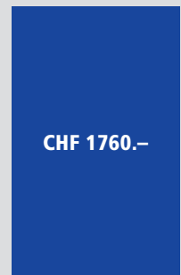
1/1 Seite 180x270 mm